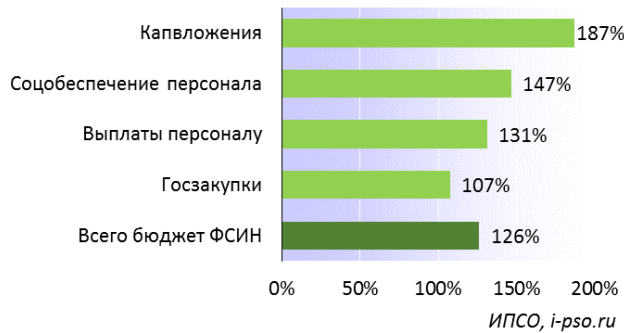
Динамика расходов бюджета, 2015 г. в % к 2012 г.

Расходы на сотрудников растут опережающими темпами по отношению к затратам на осужденных. С 2012 по 2015 годы суммарные выплаты персоналу ФСИН увеличились более чем на 30%, расходы на социальное обеспечение персонала выросли почти в 1,5 раза. В то же время объем госзакупок, из которых и обеспечивается содержание заключенных, увеличился всего на 7%.